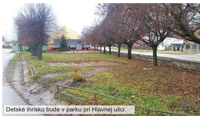
Detské ihrisko bude v parku pri Hlavnej ulici.

Celková cena ihriska je približne 10-tisíc eur. „Všetko by mal zabezpečiť samotný dodávateľ, aj terénne úpravy. Obec by mala