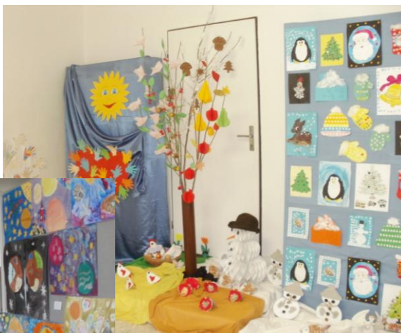
Z výstavy dětí MŠ