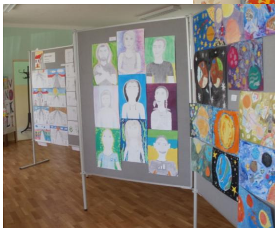
Z výstavy žiakov ZŠ