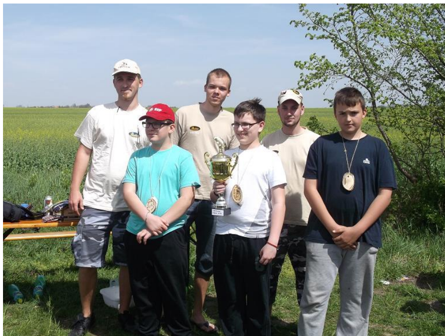
Detské rybárske preteky – účastníci s víťazom