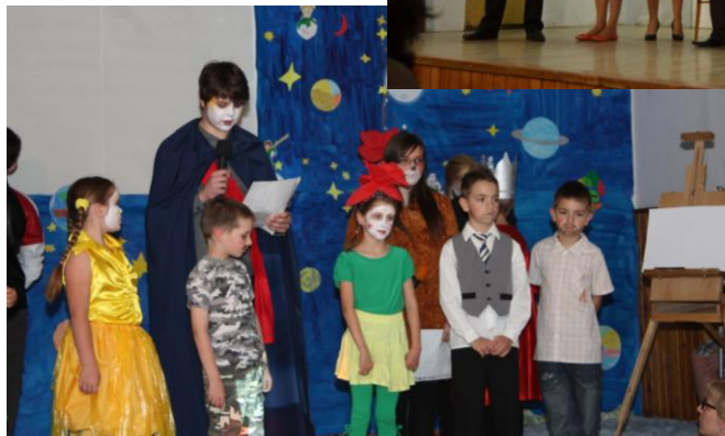
Divadlo ZŠ s hrou MALÝ PRINC