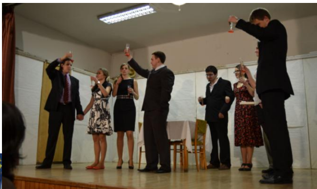
DS „DESATŮ“- v podání veselohry LEPŠÍ PÁN