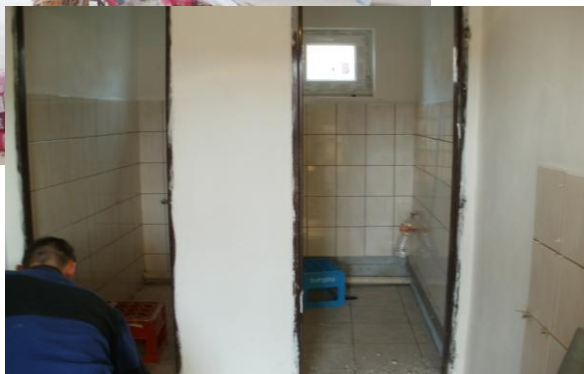
Klub mladých v čase rekonštrukcie