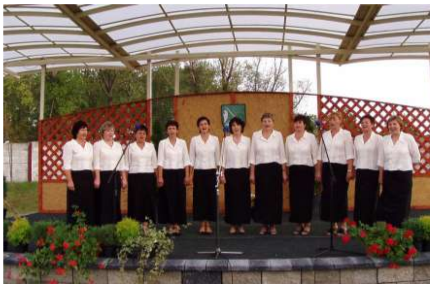
Spevokol MO Csemadok-u