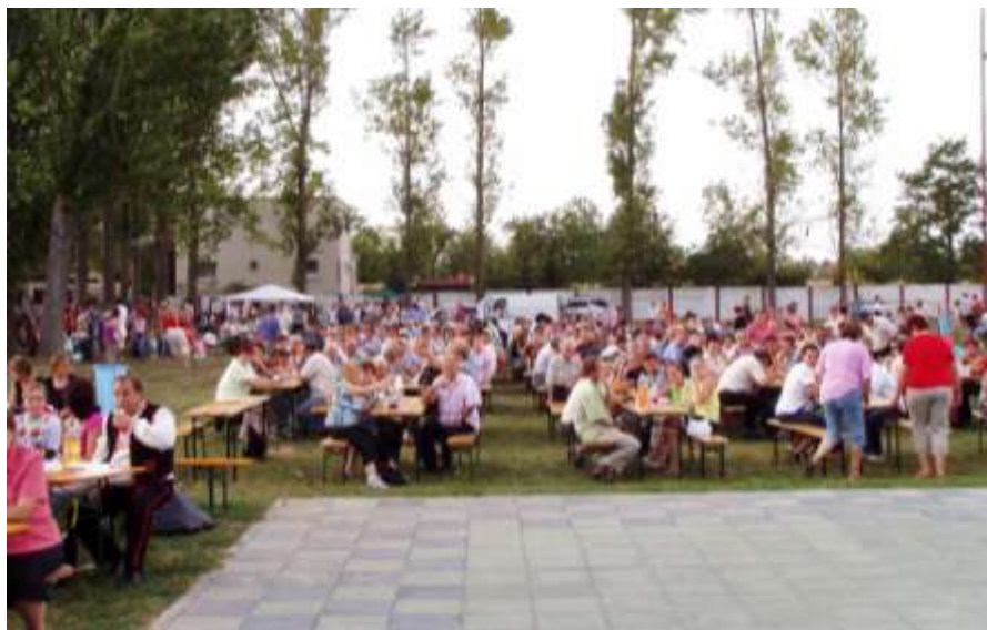
Návštevníci – hodári