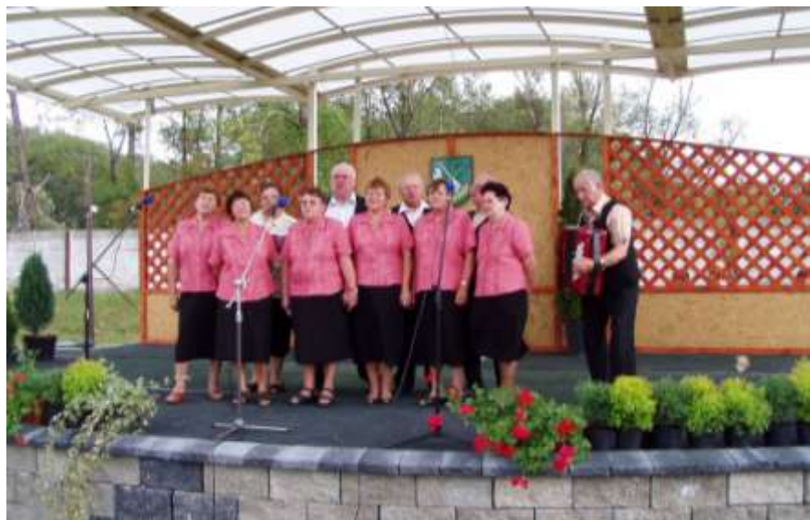
Spevácky zbor Matičiar