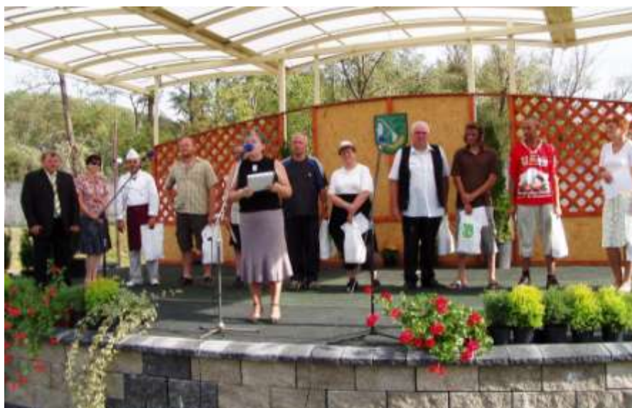
Vyhodnotenie prezentácie vo varení guláša