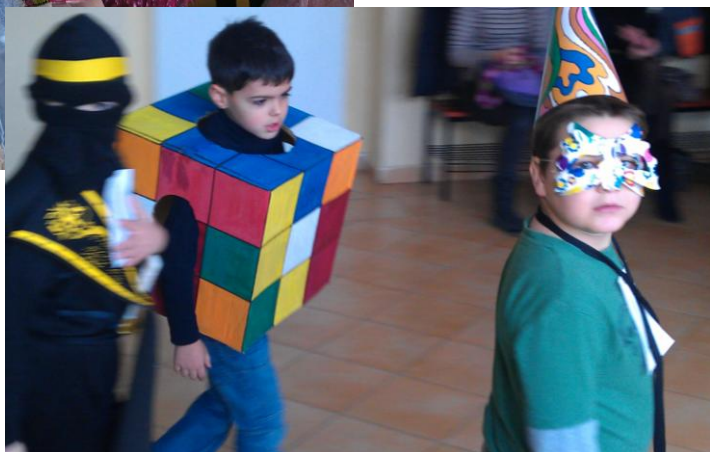
Karneval žiacov základnej školy