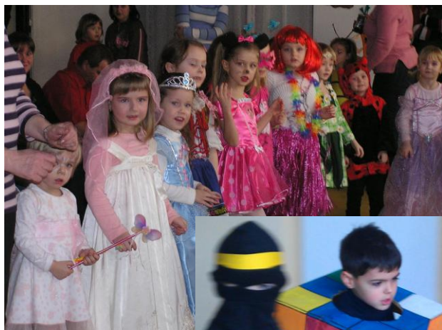
Fašiangový karneval v materskej škole