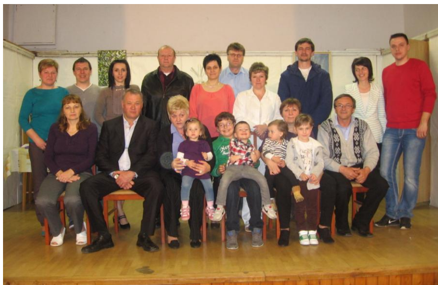
Divadelný súbor MO Csemadok-u