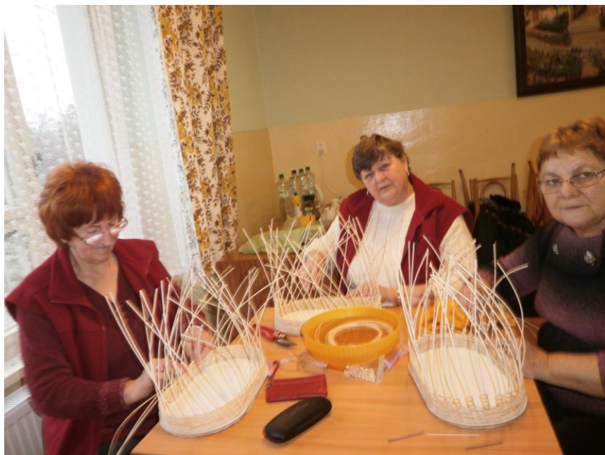
Pletenie košíkov členkami Zväzu zdravotne postihnutých občanov